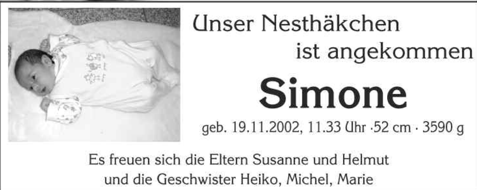
Größe 3: 3sp 50 mm

Fieguth-Amtsblätter • Friedrichstr. 59 • 67433 Neustadt • Tel. 06321 39 39-60 • Fax 06321 3939-66 • Mail: anzeigen@amtsblatt.net • www.amtsblatt.net