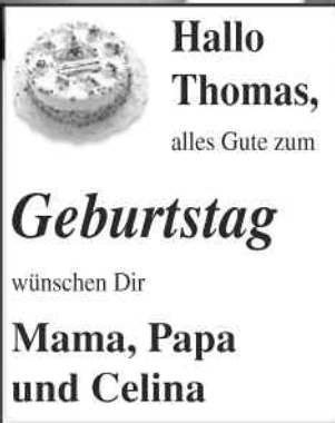
Größe 1: 1sp 50 mm