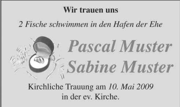
Größe 2: 2sp 50 mm