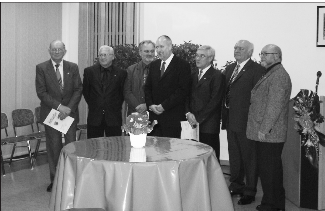
Das Bild zeigt von links:

Die Abnahme der Bevölkerung unter 20 Jahren bereite ihm Sorge. Am Beispiel von Erpolzheim erwähnte er einen Rückgang dieser Bevölkerungsgruppe in den letzten 10 Jahren von 20,5 %. Als positives Beispiel hob er Dackenheim hervor, in dem im Vergleichszeitraum eine Steigerung um 55 % zu verzeichnen sei. Die Geburtenzahlen lagen in den