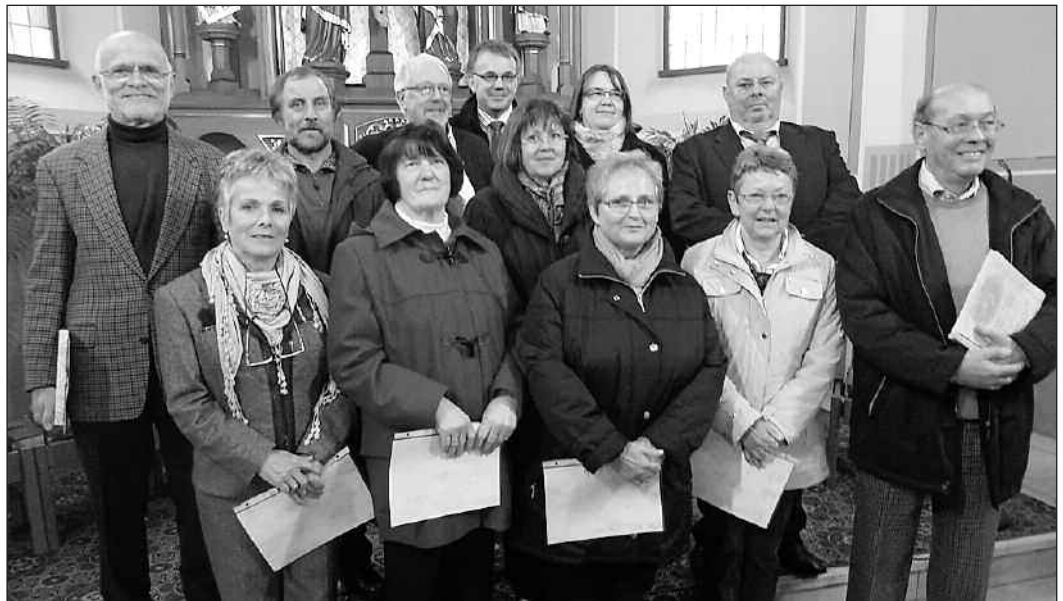
Vordere Reihe von links nach rechts:

Zum Abschluss wurde angemerkt, dass man erbrachte Leistungen nicht einfach nur nach Jahren bemessen kann. Die Basis für eine Wertschätzung bleibt die persönliche Einstellung zur Kirchenmusik, zum Chorgesang und zur Chorgemeinschaft.